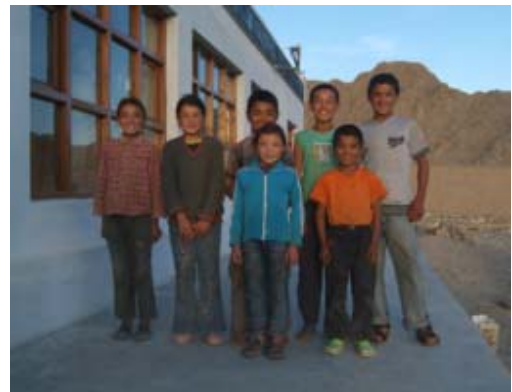
Die Kinder vom Shesrab-Hostel

Seit gut einem Jahr unterstützen wir als Friends of Lingshed dieses Internat und es ist geplant, diesen Projektteil weiter auszubauen. Das Shesrab-Hostel („Ort der Weisheit“) für Kinder aus Familien der diskriminierten Mon-Kaste steht auch für Kinder aus anderen armen Bevölkerungsschichten offen, da eine Isolierung der niedrigkastigen Kinder verhindert werden soll.