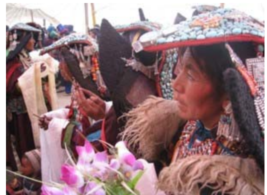
Die Bevölkerung der Region wohnt den Belehrungen des Dalai Lama in ihren traditionellen Trachten bei