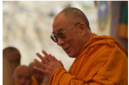
S.H. Dalai Lama in Lingshed

Ein ganz besonderes Ereignis, das die Bewohner von Lingshed sehnsüchtig erwartet haben, war der Besuch Seiner Heiligkeit des Dalai Lama in Lingshed am 15. August 2009.