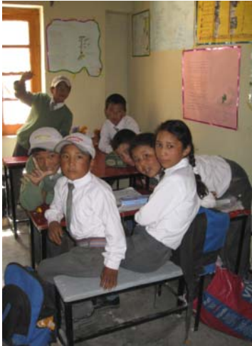
Moravian Mission School in Matho