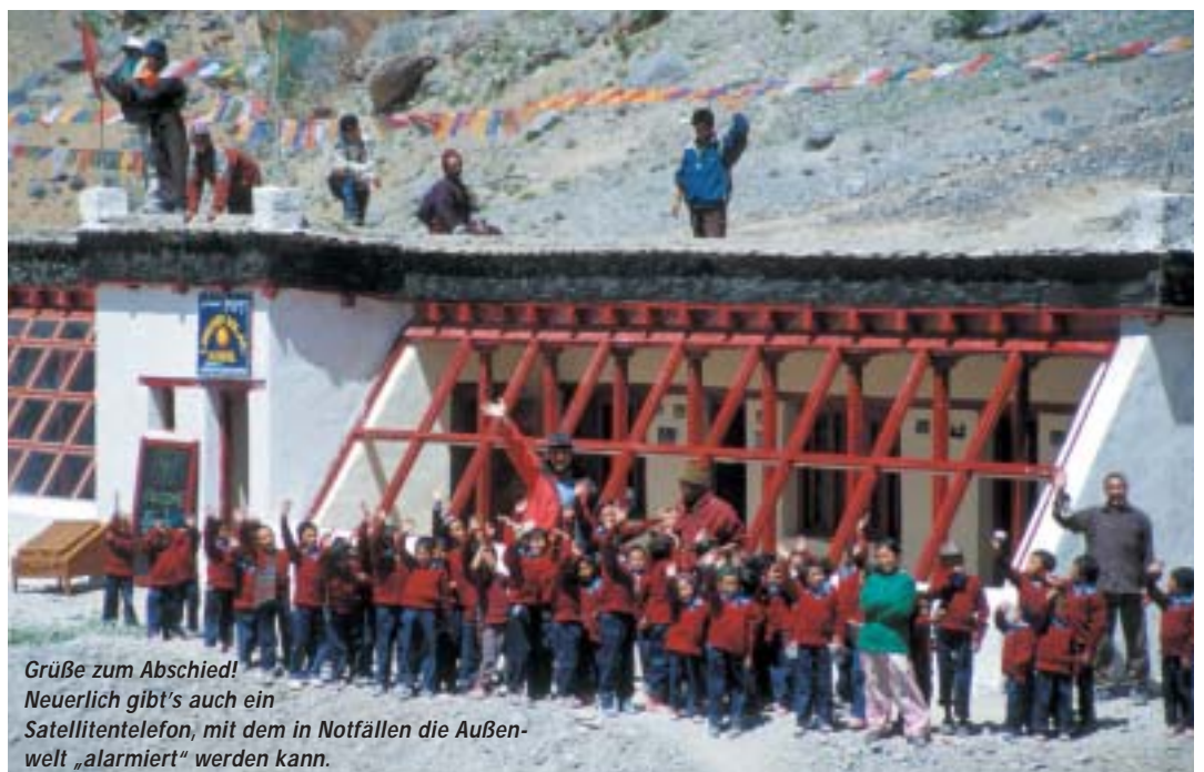
Grüße zum Abschied! Neuerlich gibt's auch ein Satellitentelefon, mit dem in Notfällen die Außenwelt „alarmiert“ werden kann.

Friends of Lingshed Tel. 03133/81 52 www.solarschule.org info@solarschule.org