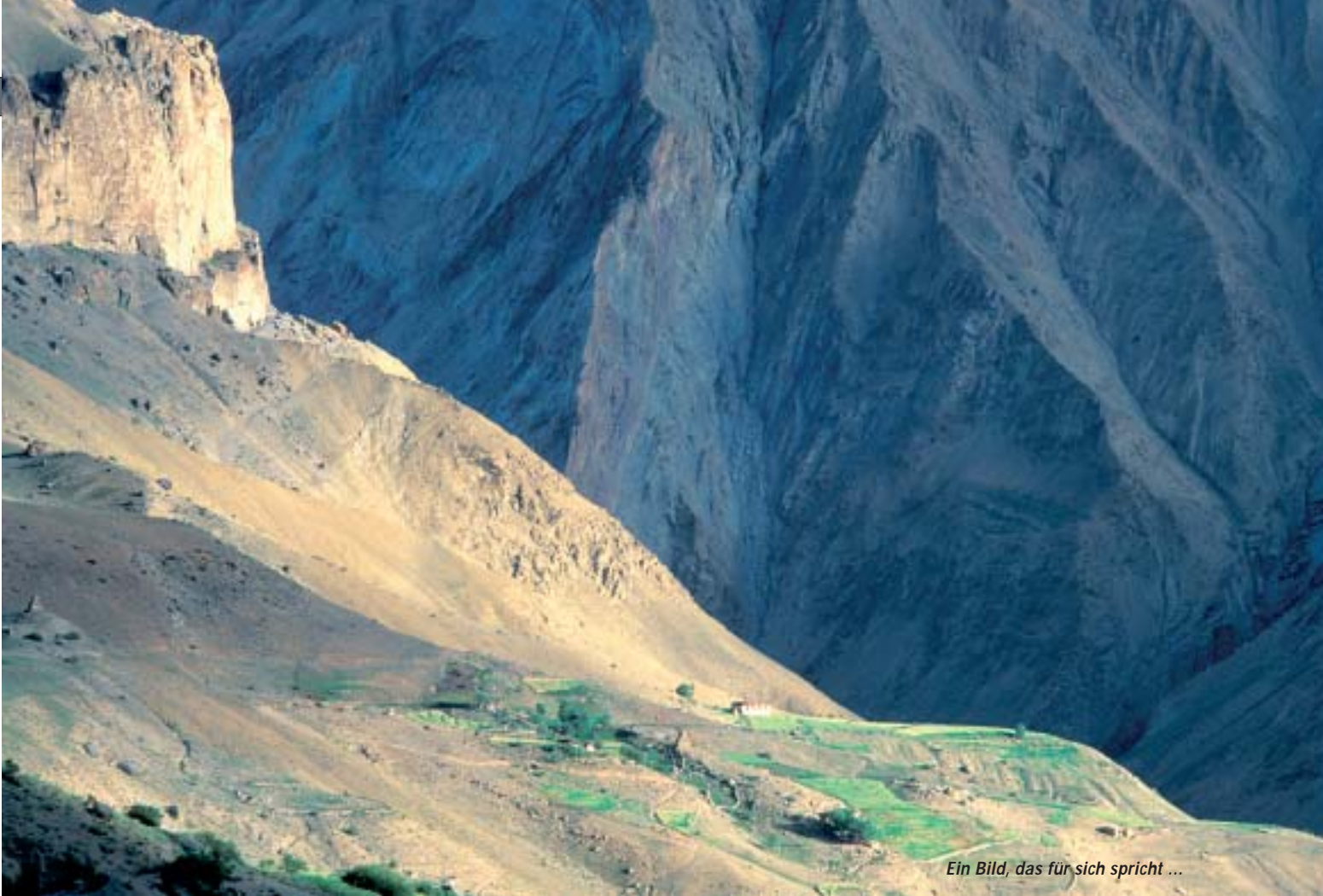
Ein Bild, das für sich spricht ...