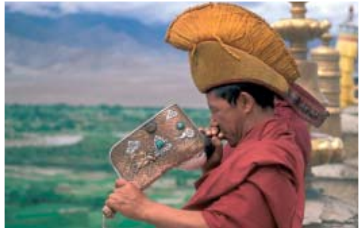
Die Mönche genießen hohes Ansehen und unterstützen unsere Landsleute.

„Entweder schlafen wir in einem Raum im Schulgebäude oder in einem Zelt nahe der Schule.“ Bei Einladungen zu den Familien der Patenkinder muss man einige Dinge beachten: Die Teppiche, auf denen man sitzt, haben oft sehr viele Flöhe,