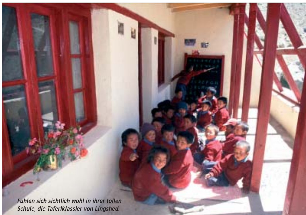
Fühlen sich sichtlich wohl in ihrer tollen Schule, die Taferlklassler von Lingshed.