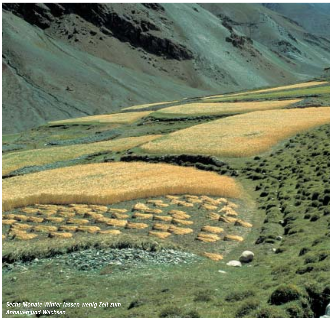
Sechs Monate Winter lassen wenig Zeit zum Anbauen und Wachsen.