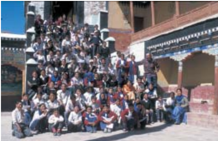
108 Patenkinder haben die Steirer. 120 Euro kostet ein Schuljahr pro Kind.

volle Anerkennung haben die Frauen hier längst verwirklicht.