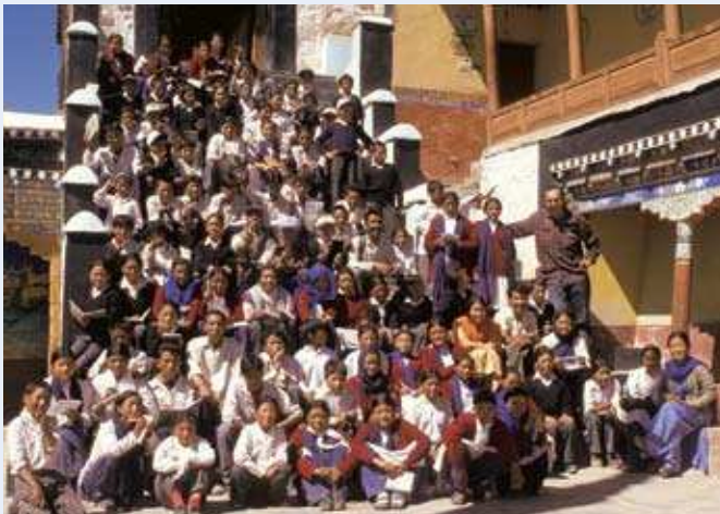
Friends of Lingshed unterstützen seit 1994 Hunderte Schulkinder in Ladakh.